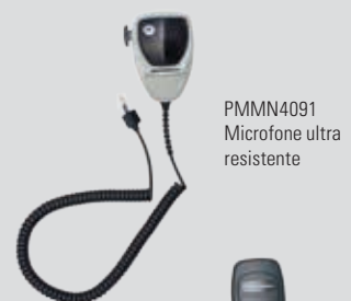
PMMN4091 Microfone ultra resistente