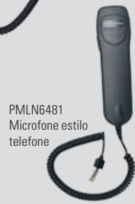
PMLN6481 Microfone estilo telefone