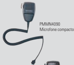
PMMN4090 Microfone compacto