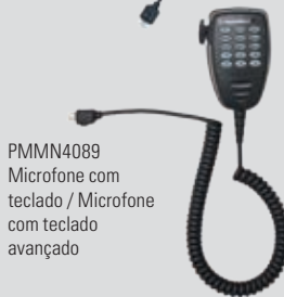
PMMN4089 Microfone com teclado / Microfone com teclado avançado